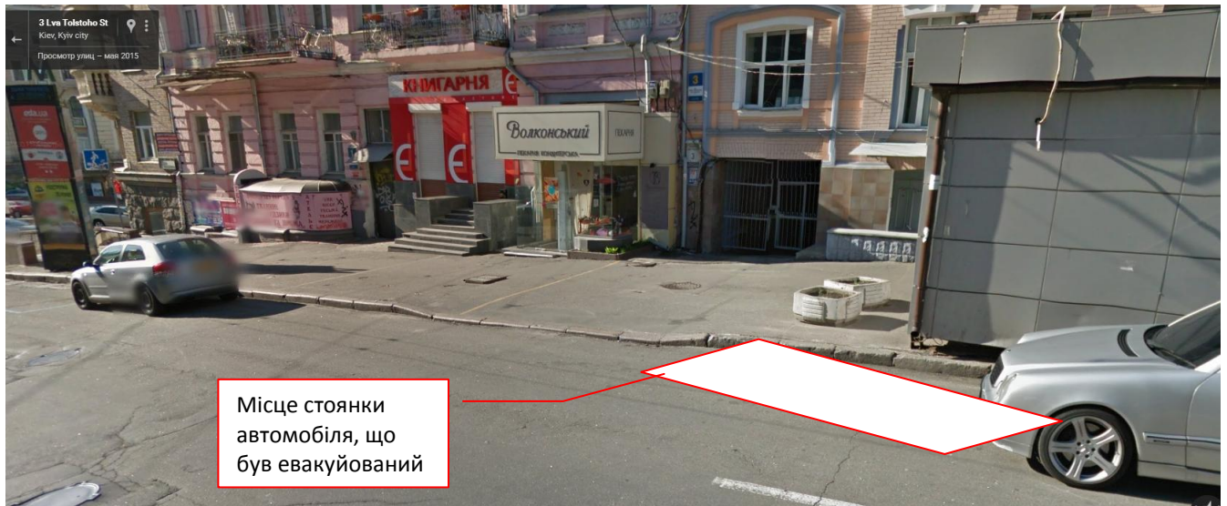
Схема розташування автомобіля що був евакуйований (використано панорамний вид із Google maps за травень 2015 р.)

Додаток Г до заяви //////////////////////////////////