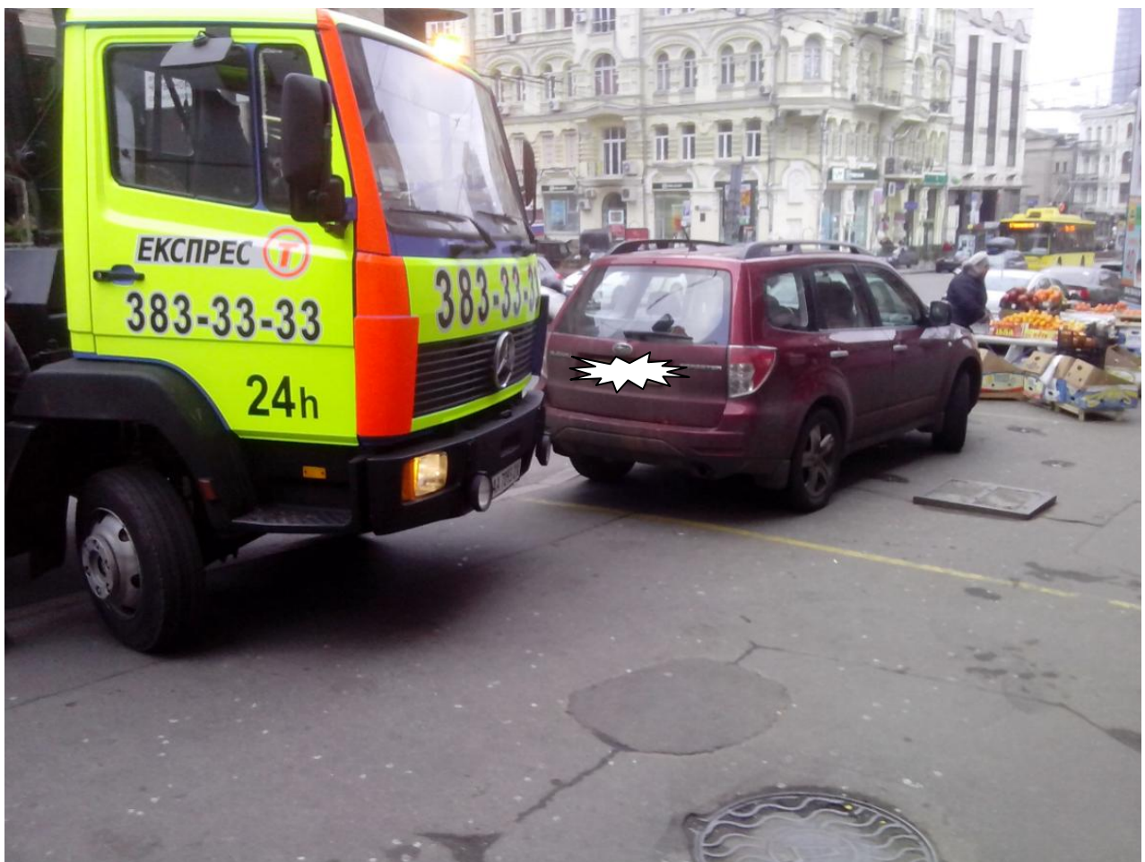
Вид автомобіля Subaru ////////////////////////////////// під час стоянки

На схемі та фото чітко видно характерні орієнтири на асфальті – каналізаційні люки, люк електромережі, бордюрний камінь під колесом евакуатора та світла риска на асфальті.