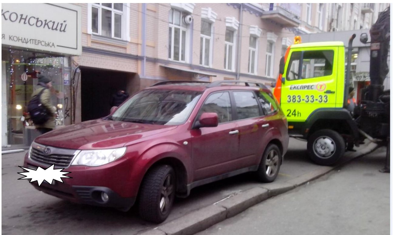
Вид автомобіля Subaru ////////////////////////////////// під час стоянки та евакуатора, що перегороджує вулицю Льва Толстого